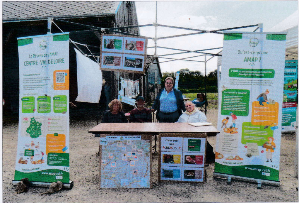
14.09.2024) Fête Paysanne ADEAR28 - stand réseau AMAP Centre - Val de Loire

Une Association pour le Maintien de l'Agriculture Paysanne, c'est un partenariat solidaire