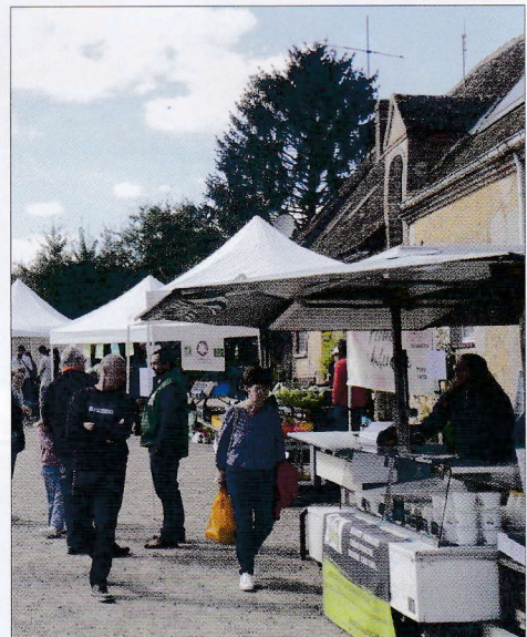
Plusieurs producteurs des environs étaient installés

Envie de créer une nouvelle AMAP ailleurs dans le département ? Contactez-nous amap.cvl@gmail.com ou 06 67 00 13 09